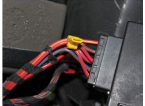
Anbringen der beiden Abzweigverbinder für die Stromversorgung des Moduls.

Für die Stromversorgung des top-comfort™ Moduls wird die +12V Leitung des Verdecksteuergerätes benötigt. Diese befindet sich im Kabelstrang am oberen Stecker. Die Kabelbäume sind mit einem Textilband umwickelt. Entfernen Sie das Band auf ca. 5cm Länge vor dem Steckergehäuse. Das erleichtert Ihnen das Anbringen der Abgreifklammer.