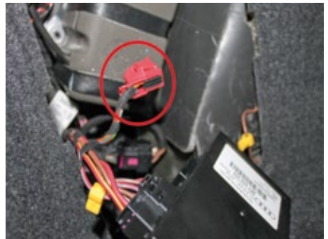
Roten Stecker durch Drücken des Rasthakens aus dem Steuergerät ziehen.

Der rote Stecker am Steuergerät ist gegen Herausrutschen gesichert. Er lässt sich durch Drücken des Rasthakens auf der Oberseite vom Verdecksteuergerät lösen.