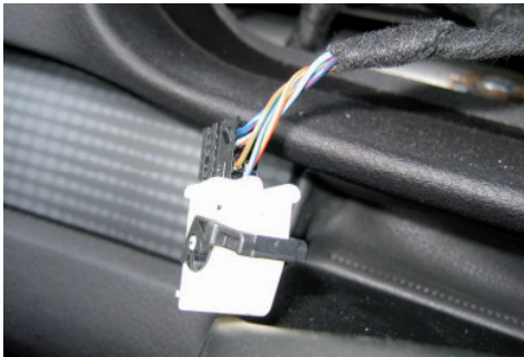
Rasthaken beidseitig wegdrücken, dann Buchsenleisten aus dem Steckergehäuse ziehen.

Ziehen Sie beide Stecker ab und entfernen Sie die Instrumenteneinheit seitlich am Lenkrad vorbei.