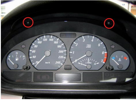
Markierte Schrauben lösen und Kombiinstrument nach vorne herausziehen.

Ausbau des Kombiinstrument Die Instrumentenkombi Ihres BMW ist mit zwei Schrauben im Armaturenbrett verschraubt. Stellen Sie das Lenkrad mit der Höheneinstellung ganz nach unten und ziehen Sie es so weit wie möglich heraus. Dies erleichtert die Demontage der Instrumenteneinheit. Lösen Sie die beiden Torxschrauben und ziehen Sie die Instrumenteneinheit nach vorne heraus. Evtl. mit einem Montagekeil vorsichtig nachhelfen.