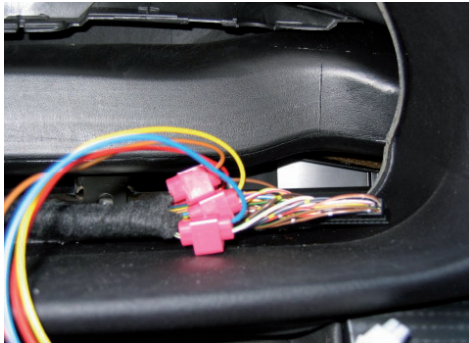
Abzweigverbindungen laut Übersicht befestigen. Auf ausreichend Abstand achten!

Verbinden des Kabelbaums Der Kabelsatz des data&lightcomfort™ Moduls wird gemäß der Anschlussübersicht (siehe unten) am Kabelbaum des Fahrzeugs befestigt. Die Abzweigverbinder sollten versetzt am Kabelbaum angebracht werden, damit dieser nicht zu dick wird. Ein zu dicker Kabelbaum kann den Einbau der Instrumentenkombi blockieren!